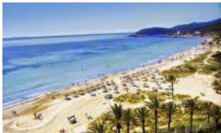
Playa d'en Bossa