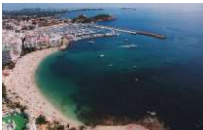
Playa Santa Eulalia del Río