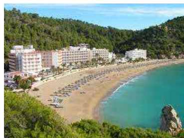
Playa San Vicente