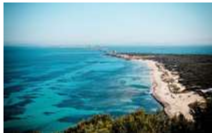
Playa es Cavellet