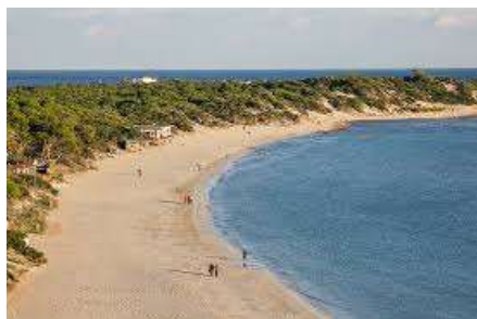
Playa Ses Salines