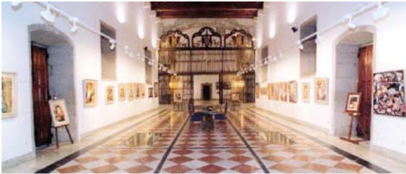
Hostal dos Reis Católicos -Sala de exposições-